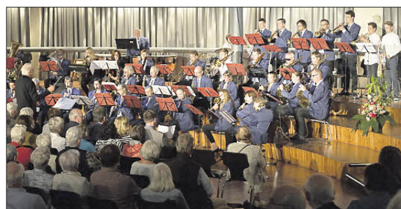
Große musikalische Bandbreite zeigte das Jubiläumskonzert des Bläserorchesters Marialinden (links). Einheitlich gekleidet traten MGV Liederkranz und MGV Concordia auf (rechts).

„Schnell waren wir uns einig, etwas zusammen auf die Beine stellen zu wollen“, erinnert sich Scholz. Gesagt – getan. Mit Liedern unter anderem von BAP, Heinz Rudolf Kunze, Alice Cooper oder Marius Müller-Westernhagen im Gepäck rückten die Musiker von Paul Akustik-Rock zum Benefiz-Konzert an – und begeisterten die Besucher. 1110 Euro an Spenden kamen laut Gronewald am Ende zusammen. (wg)